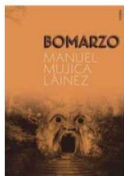
Son ouvrage préféré : « Bomarzo », de Manuel Mujica Lainez, éd. Le Cherche Midi, 928 pages.