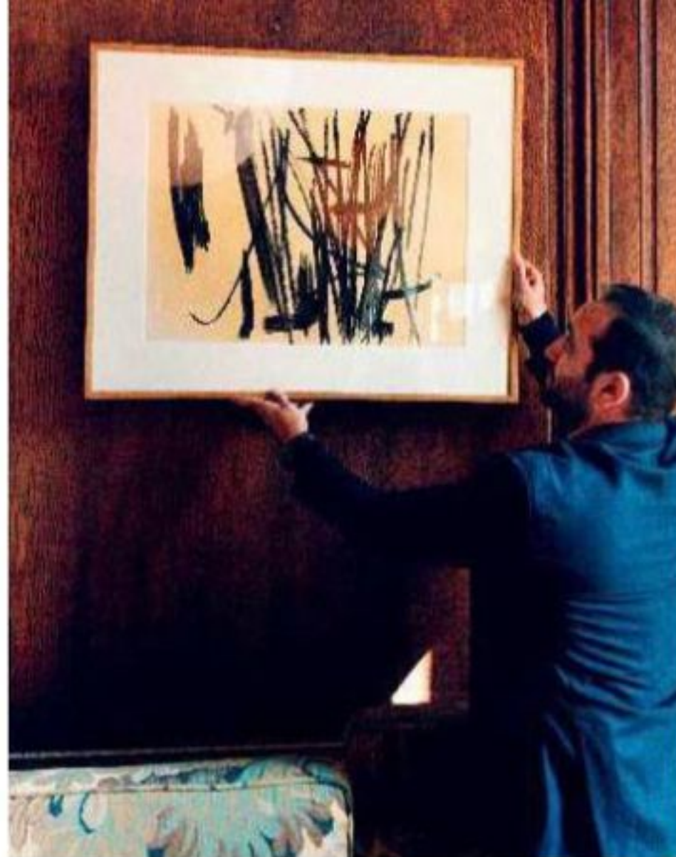
Un tableau de Hans Hartung (galerie Kraemer) est à admirer au Victoria.