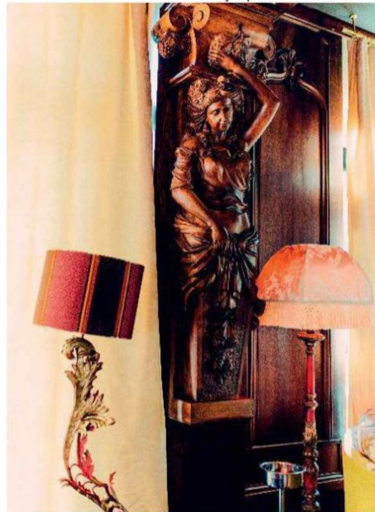
Une cariatide spécialement conçue pour le Victoria.

Dans une autre vie, j'aurais pu être... sculpteur. Une façon de peindre en 3D. La manière la plus pure de créer dans un espace. ■